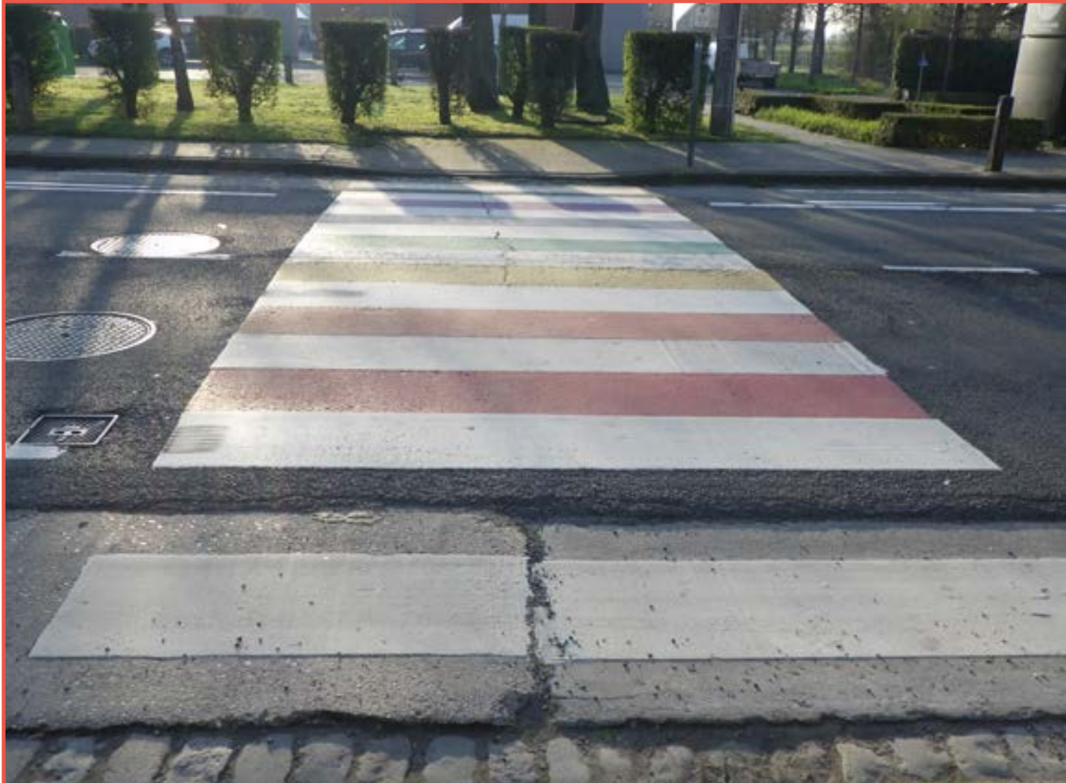
Ondergrond oneffen en niet drempelloos